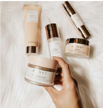
SKINCARE & MAKEUP