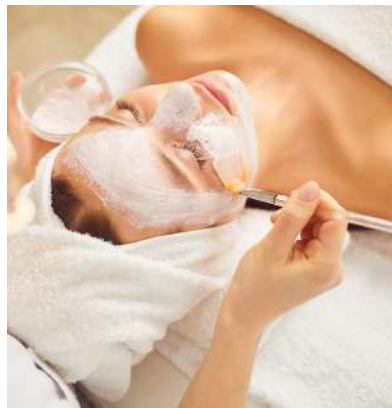
LIMPIEZAS & PEELING