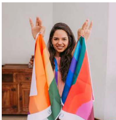
ASESORÍA DE IMAGEN